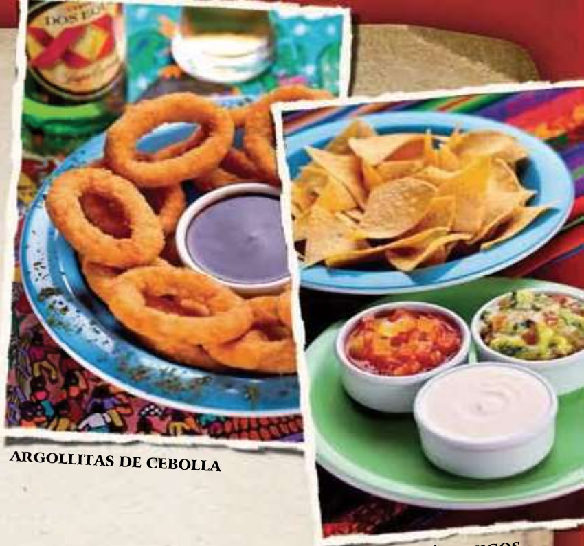
ARGOLLITAS DE CEBOLLA

507 TIRITAS DE POLLO _____ R$ 39 Tirinhas empanadas de frango servidas com sour cream e salsa picante.